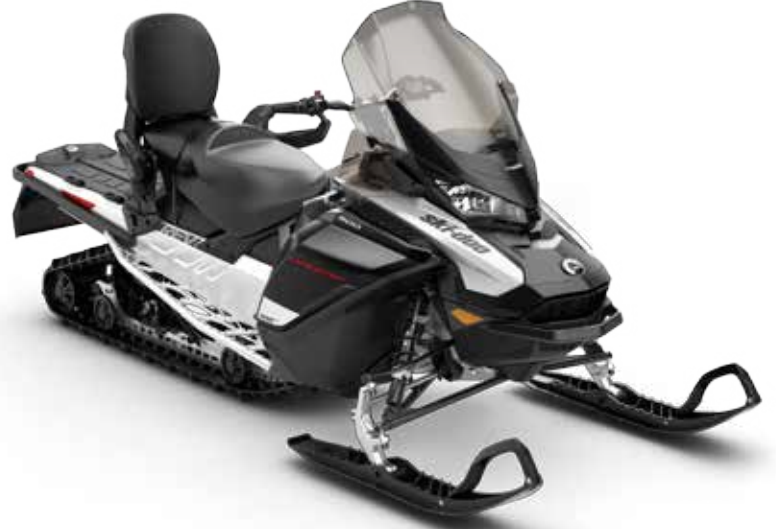
Kuvassa EXPEDITION® SPORT 900 ACE™