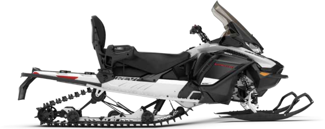
Kuvassa EXPEDITION® SPORT 900 ACE™